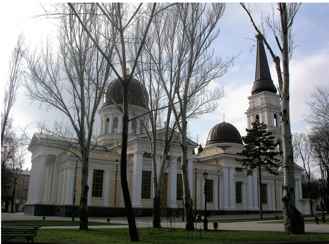
Рис. 3 Відтворений кафедральний Спасо-Преображенський собор

Використання методів моделювання, логіки та інших при формуванні традиційного характеру історичного середовища Соборної площі Одеси дозволило обґрунтовувати прийняті рішення, в результаті реалізації яких місту було повернуто один з його символів (рис. 3).