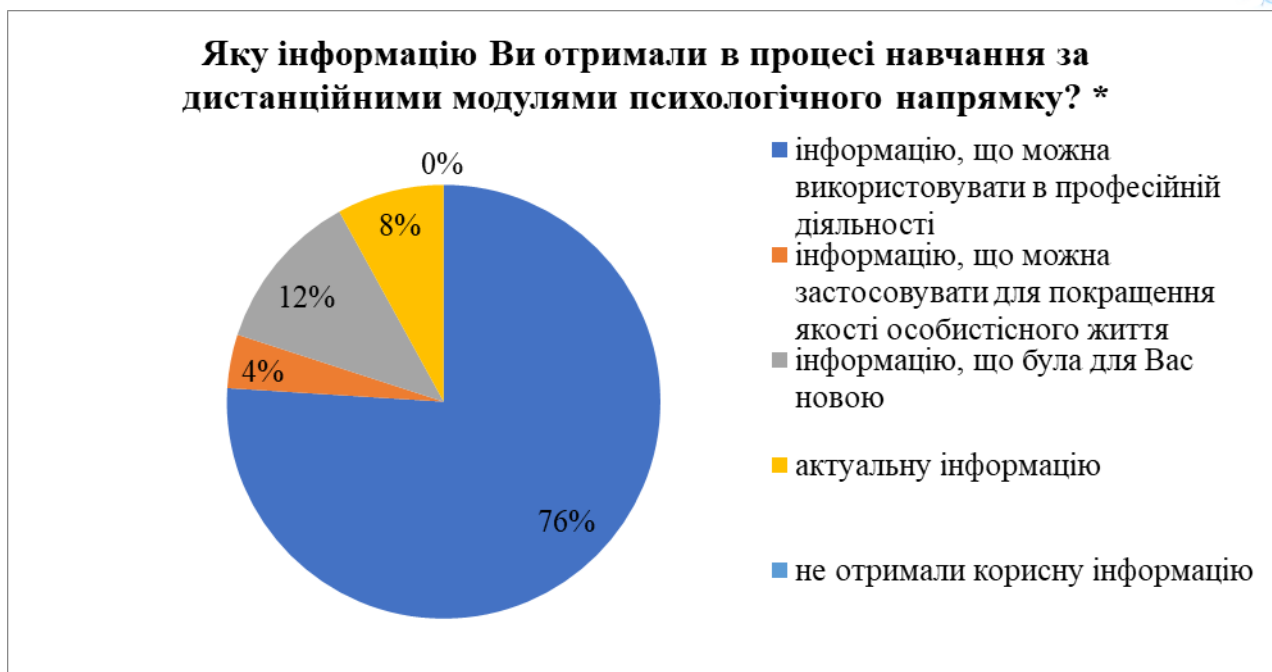
Малюнок 3 - Дослідження інформаційних уподобань слухачів курсів підвищення кваліфікації.