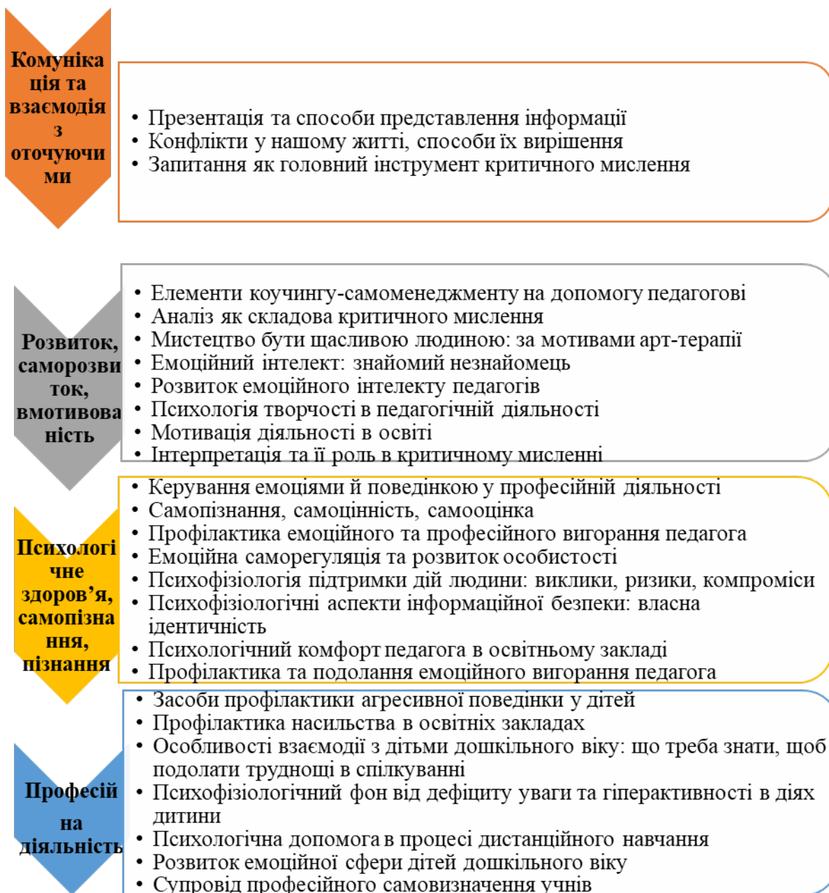
Малюнок 1 - Схема диференціації навчальних дистанційних модулів.

Враховуючи різноплановість тематики навчальних модулів дистанційного навчання, ми продиференціювали наявні навчальні модулі шляхом об'єднання їх у блоки враховуючи напрямки психологічної просвіти. (малюнок 1)