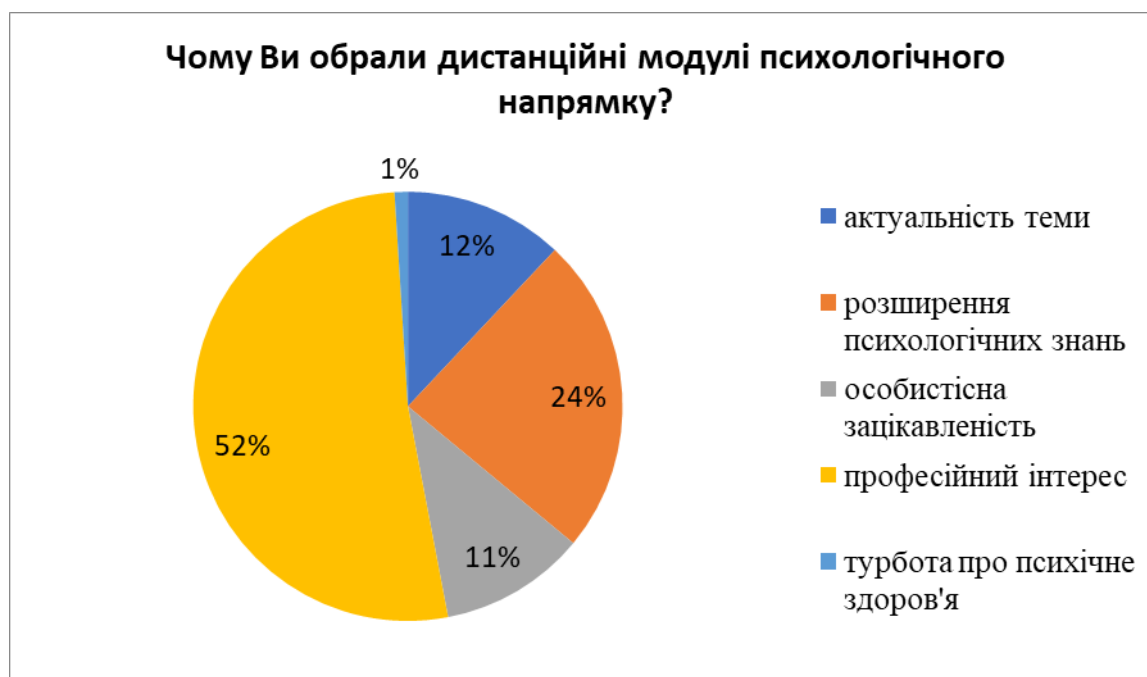
Малюнок 2 - Дослідження мотивів вибору слухачів курсів підвищення кваліфікації серед модулів психологічного спрямування.

На жаль, вибір варіанту відповіді про “турботу про психічне здоров'я” зробив лише 1% слухачів. А це може свідчити про низький рівень психологічної просвіти в напрямку психопрфілактики та психогігієни. Й потребує подальшого дослідження.