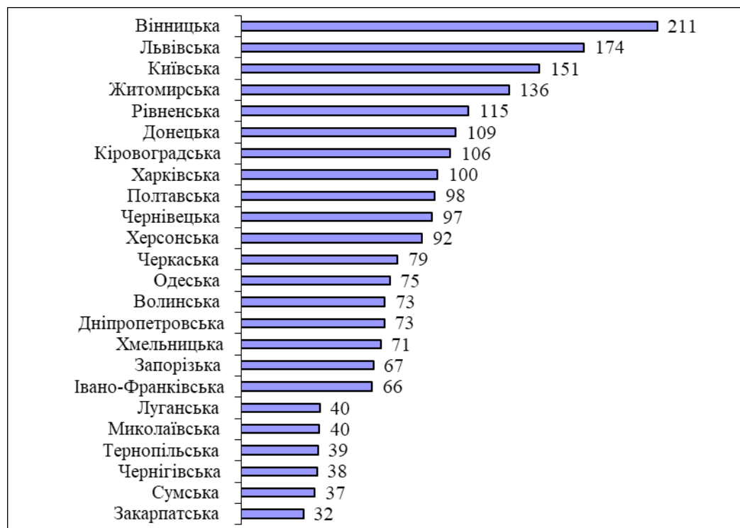
Рис. 2. Динаміка виробництва часнику в розрізі областей України у 2020 р., тис. ц