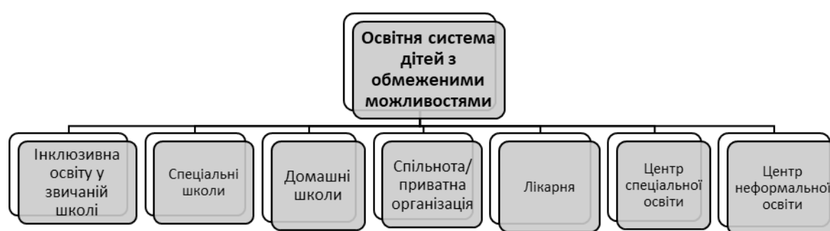
Рисунок 2. Структура варіантів навчання дітей з обмеженими можливостями в Таїланді.

У наведеному нижче малюнку пояснюється, що може надаватися діти шкільного віку з обмеженими можливостями: супутніми послугами, такими як слухові апарати, інвалідні візки та комунікативні електронні пристрої. (Див. рисунок 2.)