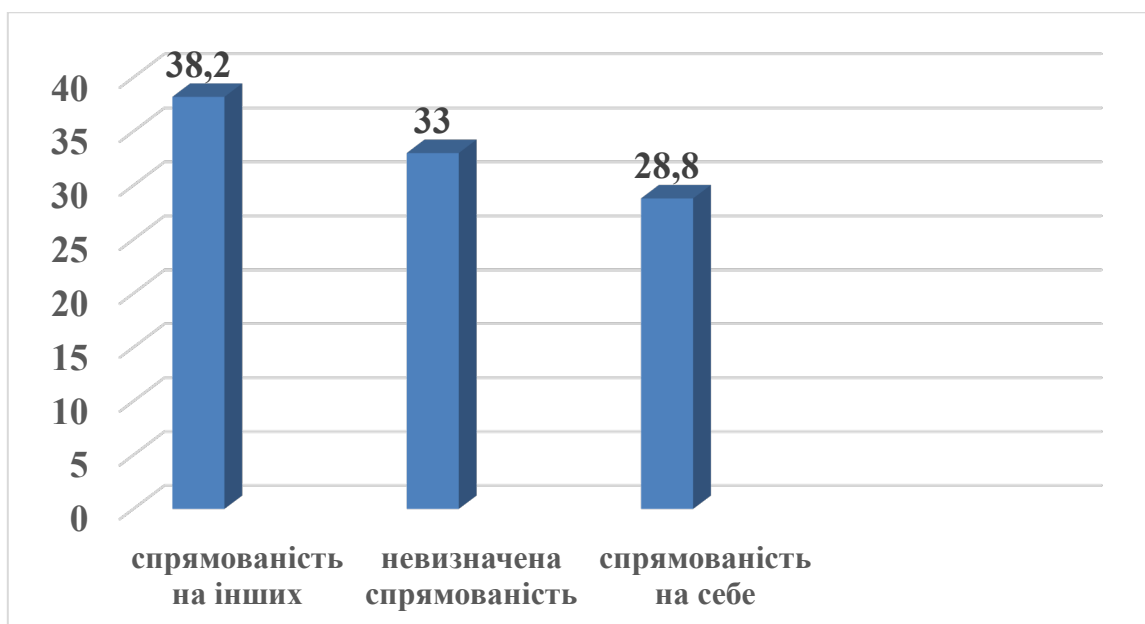
Рисунок 2. Розподіл студентів за вектором спрямованості агресії у %

фону та емоційної нестійкості, яка характерна для періоду ранньої молодості. Це підтверджують і дані аналізу співвідношення показників гетеро- та ауто- агресії, за якими виявлено розподіл досліджуваних студентів за вектором спрямованості агресії (спрямованість на інших; невизначена спрямованість; спрямованість на себе) (рис. 2).