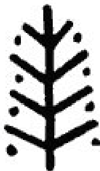
Рисунок 1. Символ дерева життя [6].

Українському розпису притаманні і окремі елементи трипільської культури, зокрема, розписи на глечиках: плавні дугоподібні орнаменти, малюнки тварин. Один з найбільш поширених символів розпису української хати – дерево життя (рис. 1) [6].