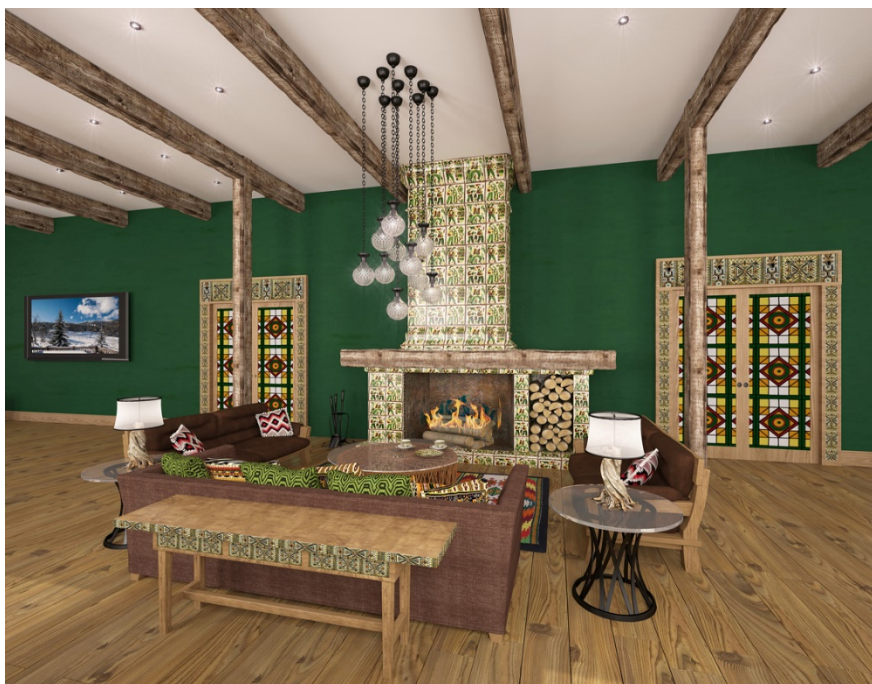
Рисунок 4. Етнічні мотиви гуцульщини в декоруванні камінної зони туристичного котеджу [10]

Естетично виразно в інтер'єрах приміщень виглядають плавні та фігурні форми орнаментів: рослинних, геометричних – у вигляді панно. Як приклад, можна навести проекти Київської студії Brick-Brot studio. При розробці дизайну спальні та вітальні використані орнаментальні панно для декору, де акцентна роль належить червоному кольору, одному з головних в українському мистецтві (рис. 5) [11]. Основним кольором українського етнічного стилю, як правило, є білий. Його доповнює яскравий декор червоного, чорного, рідше блакитного, синього, зеленого, коричневого та інших кольорів, залежно від регіону України.