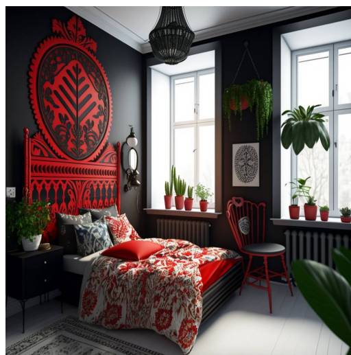
Рисунок 5. Дизайн інтер'єрів в сучасному стилі [11].

Виразно-естетичні особливості традиційного українського розпису – Петриківського стали родзинкою на всесвітньовідомій французькій Рив'єрі, де в місті Ніцца оформлення інтер'єрів ресторану української кухні здійснювала