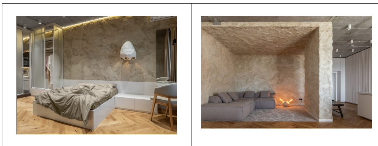
Рисунок 3. Квартира - мазанка. Дизайн-пропозиція: Сергій Махно, Віктор Захарченко, Сергій Філончук [9].

Традиції народного декоративного живописного розпису живуть, успішно розвиваються і в наш час. Досить цікава пропозиція студентки магістратури Черкаського державного технологічного університету Корякіної Арини в дипломній кваліфікаційній роботі магістра за темою: «Етнічні мотиви гуцульщини в дизайн-проектванні інтер'єрів сучасних туристичних котеджів» щодо декорування стін і меблів зони каміну (рис. 4) [10].