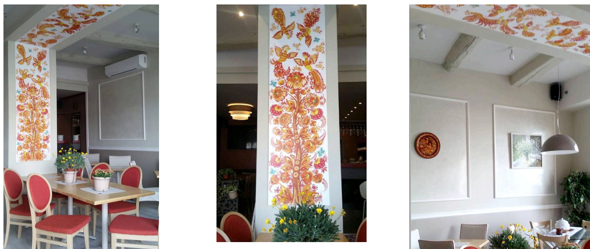
Рисунок 6. Петриківський розпис стін ресторану української кухні у м. Ніцца [12].

відома українська художниця з Дніпропетровщини, майстриня петриківського розпису, Вікторія Тимошенко (рис. 6) [12].