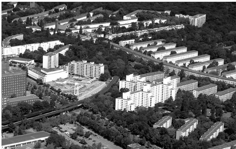
Рисунок 2 - Поселення «Сіменсштатт» у м.Берлін, Німеччина (1929-1934 рр.). Арх-ри: Ганс Шарун, Вальтер Гропіус