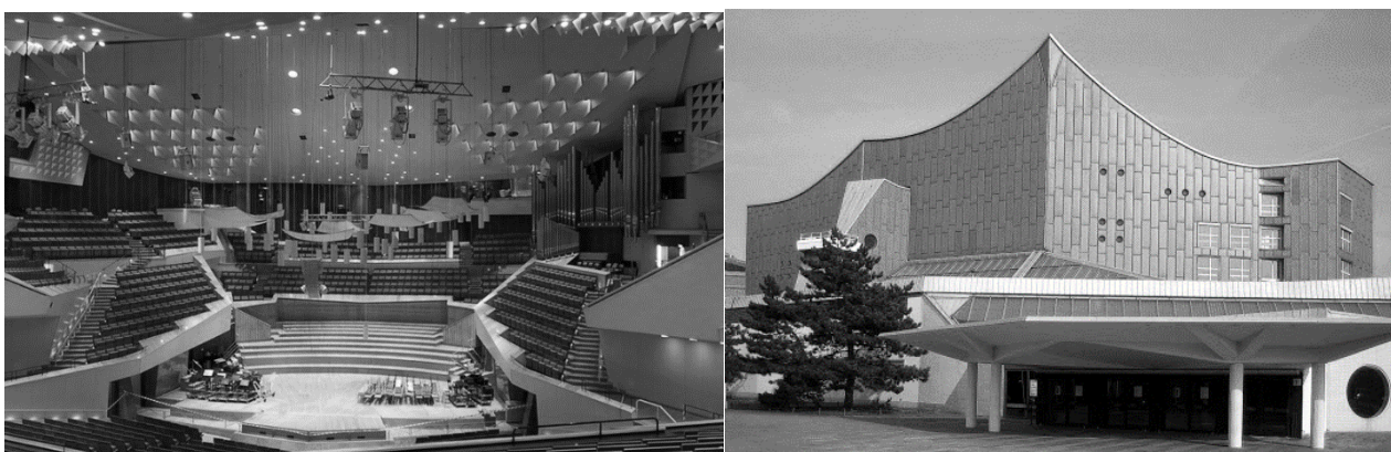
Рисунок 3 - Берлінська філармонія в м.Берлін, Німеччина (1960-1963 рр.). Арх-р: Ганс Шарун

У концертній залі Берлінської філармонії (рисунок 3) Гансу Шаруну вдалося створити по-справжньому унікальний музичний простір, який демонструє зв'язок з людиною і музикою. У даній будівлі цей простір створено круговим розміщенням глядачів навколо оркестру, що було зроблено для того, аби слухачі були якомога більш активними, і сам концерт залишив свій слід в душі кожного присутнього [4]. Роль «серединного простору» тут відведена концертному подіуму, навколо якого розташовується глядацька аудиторія, яка має унікальну можливість поспостерігати за емоційною реакцією інших глядачів на те, що відбувається.