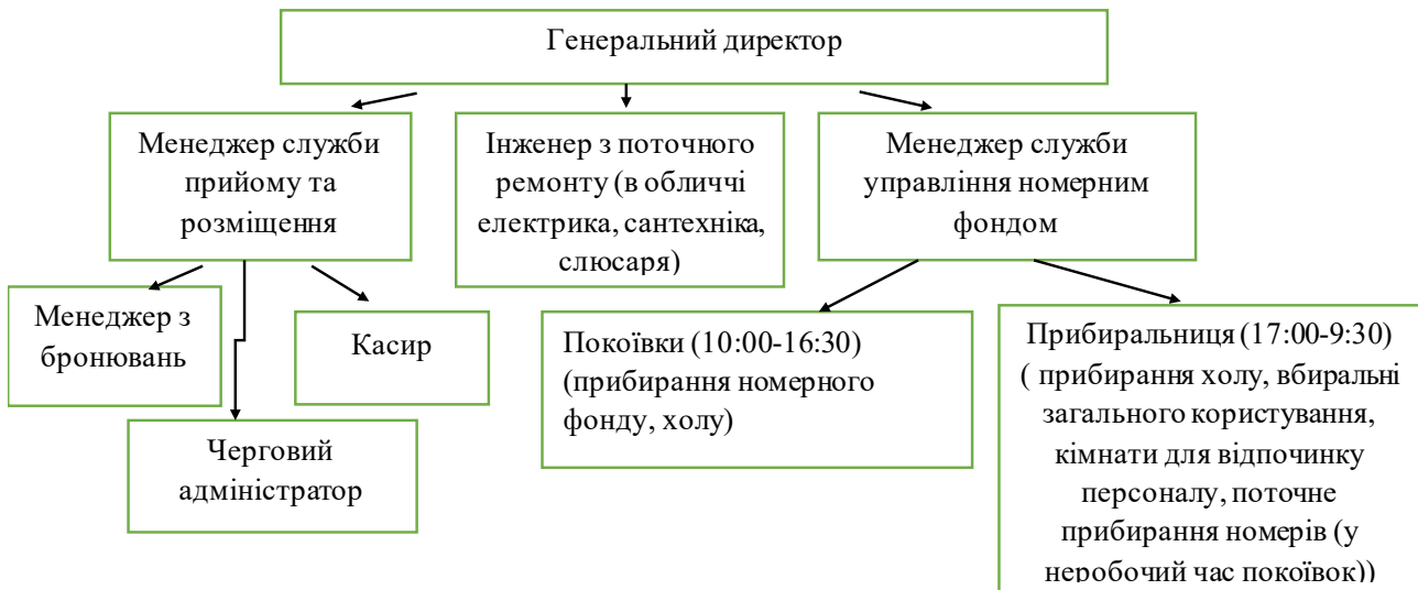
Рисунок 1 - Організаційно-функціональна структура готелю «Hermitage Boutique-Hotel»

Його організаційно-функціональною структурою є лінійний тип (рис.1).