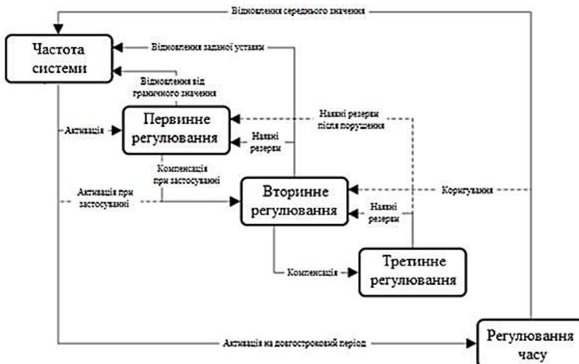
Рисунок 1 – Функціональна структура побудови системи регулювання частоти та потужності в ОЕС України

Вторинне регулювання – це централізована автоматична функція, яка контролює виробництво електроенергії в зоні регулювання. На процес регулювання частоти в енергосистемі мають вплив і споживачі, адже згідно статичної характеристики навантаження по частоті і напрузі у разі відхилення цих компонентів змінюється і фактичне споживання потужності у споживача. Варто відзначити, що програмний комплекс PowerFactory дає можливість швидкого налаштування первинного та вторинного регулювання, а також СХН кожного споживача. На рис. 1 наведено функціональну структуру побудови системи регулювання частоти та потужності в ОЕС України.