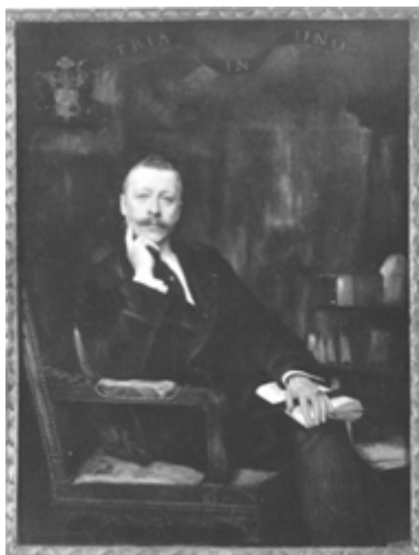
Його Ясновельможність Володимир Володимирович Мурав'юв-Апостол-Короб'їн. Портрет. Полотно, олія, 90×110 см. Габріель Ферр'є. Париж. 1911 р. Світлина*.

генеалогічні таблиці та фотокопії деяких важливих документів (Виписка з Загального Гербовника дворянських родів Всеросійської імперії, Свідоцтво про народження та хрестини та Некролог у «Tribune de Genève»).