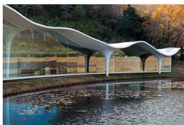
Рис. 5. Приклади навісів та павільонів. (Фото з відкритих джерел).