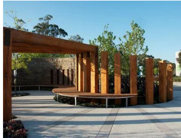
Рис. 1. Приклади малих архітектурних форм. Навіси.