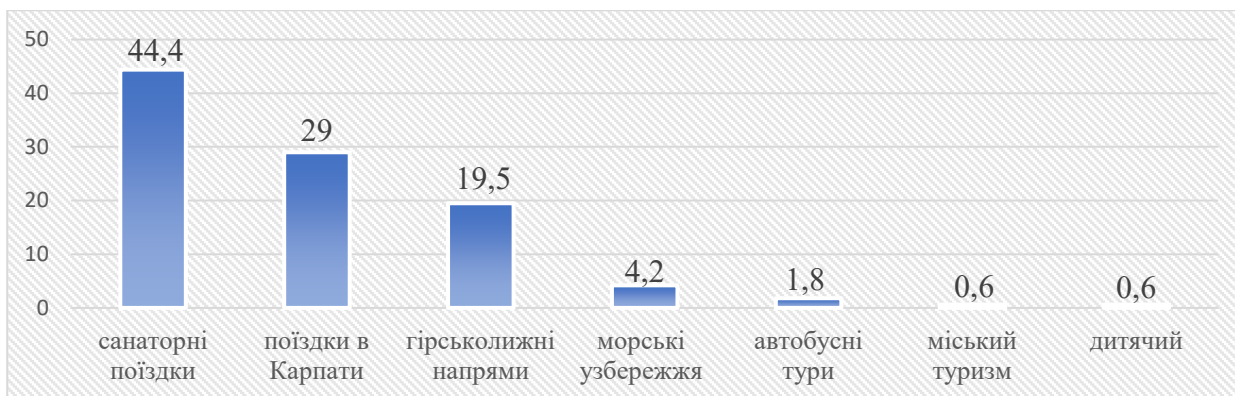
Рисунок 2. Напрямки подорожей внутрішнього туризму в Україні (станом на листопад 2022)