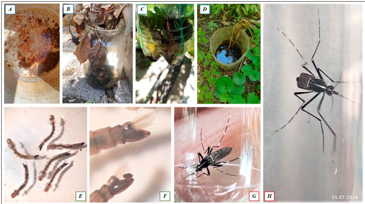
Рис. 2 - Місця виплоду і зразки Aedes albopictus , які виявлені у локаціях міста Одеса у 2024 році: A - D – місця розмноження (штучні ємності з водою); E - F – Личинки 4 віку Ae. albopictus ; G - H – Імаго Ae. albopictus (Ad ♀) з характерними ознаками

Кліматичні фактори відіграють особливу обмежуючу роль у стримуванні розвитку та виживанні комарів. Температура і вологість середовища, їх співвідношення є ключовими обмежувачами факторами у помірних регіонах.