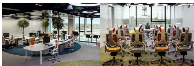
Рис. 2. Інтер'єр робочого простору офісу академії «ACADEMY 2.0.» Київ, Україна, 2020 [6].

Оригінальним прикладом застосування сучасних підходів у створенні інтер'єрів офісних приміщень закордоном є офіс компанії Rooser в Лондоні, розроблений дизайн студією Peldon Rose [4]. Компанія займається онлайн торгівлею морепродуктів. Загальна площа офісних приміщень складає 944 кв.м. В офісних приміщеннях створено кілька кишень простору для різних цілей, вони заохочують співробітників до самостійності щодо свого оточення відповідно до своїх потреб. Кімнати для переговорів і телефонні будки, робочі столи