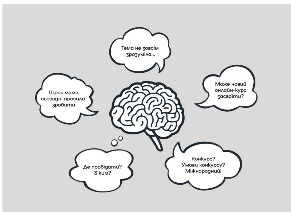
Ілюстрація 2. Орієнтовний перелік когнітивних процесів мозку [10].

інформацію. Щосекунди у мозку студента відбувається величезна кількість власних когнітивних процесів, які впливають на рівень опанування матеріалу (Іл. 2), відповідно до чого, – ефективним методом оптимізації навчання є інформування студентів на перших заняттях семестру про мету набуття знань з даного контенту, його навчальні цілі. Знання, сформульовані на самому старті, одразу ж спрямовують увагу студентів на той матеріал, який варто засвоїти, а який використовують для оцінювання знань. Тобто, спочатку потрібно визначити цілі, а потім – знання і навички, необхідні для їх досягання, критерії їх оцінювання.