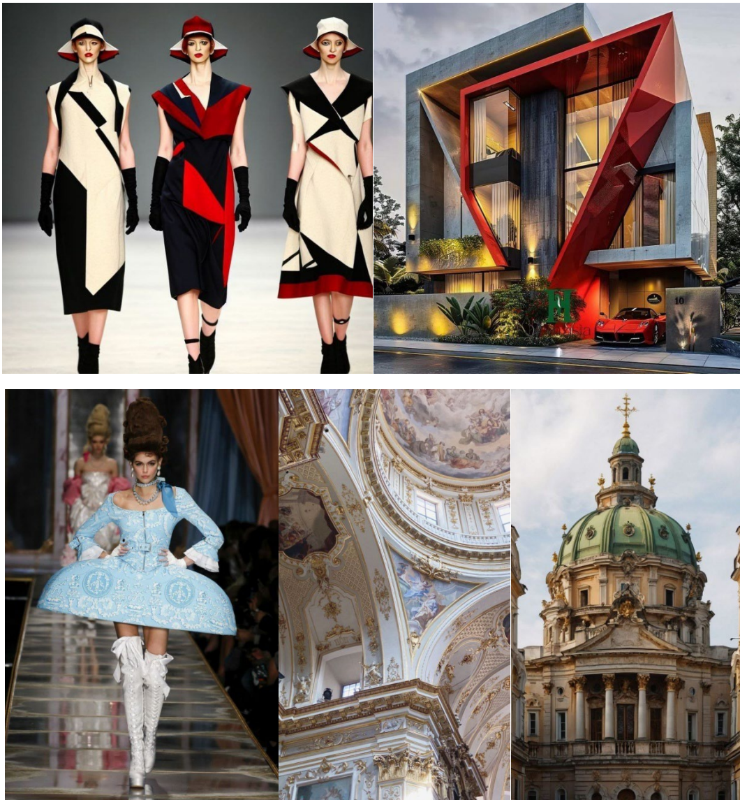
Рисунок 1 – Візуальні паралелі між архітектурою та модою

архітектури. Для архітектури і моди, за Н. Барною, характерні: спільність художньо-пластичних переживань, динамічний формотворчій простір, композиційні підходи на засаді поетики (ідея, сюжет, тема, або ширше – міф, ідеологія, філософська підстава естетики), програма світоутворення, засоби виразності [4].