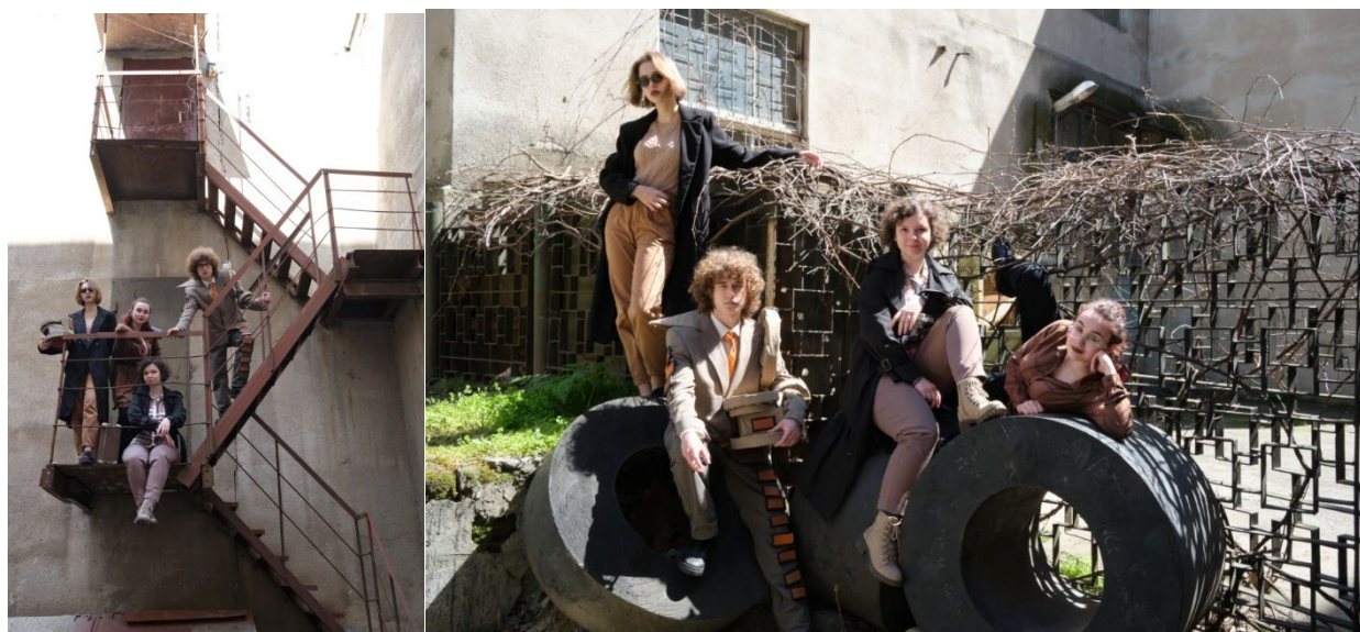
Рисунок 2.5 – Варіанти інтерпретації конструктивізму в моді, а також реалізацію модного ескізу