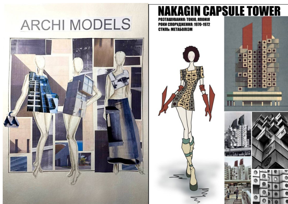
Рисунок 2.4 – Мода хмарочосів