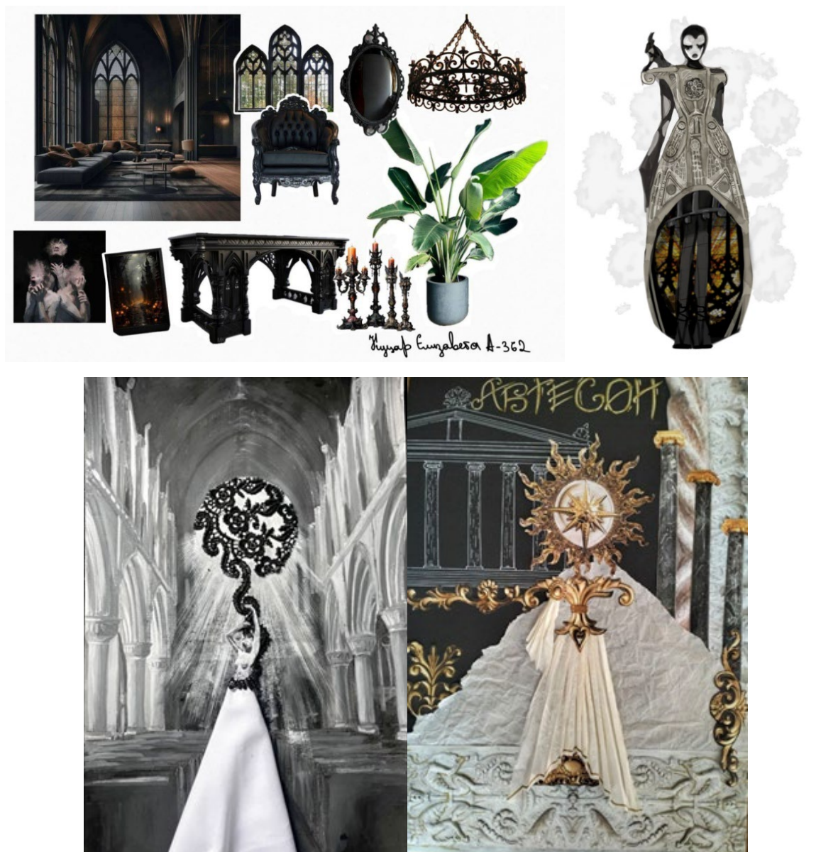
Рисунок 2.1 – Сучасний історизм в дизайні одягу

відігравав би роль модного молодіжного орієнтиру або сучасної модної тенденції [5-10]. На рисунках 2.1 - 2.4 представлені пошукові справи студентів 1-3 курсів зі стильового формоутворення.