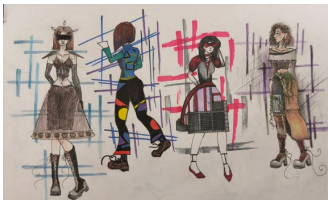
Рисунок 2.2 – Молодіжна еkleктика міських трущоб